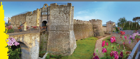
CASTELLO ANGIOINO-ARAGONESE DI AGROPOLI